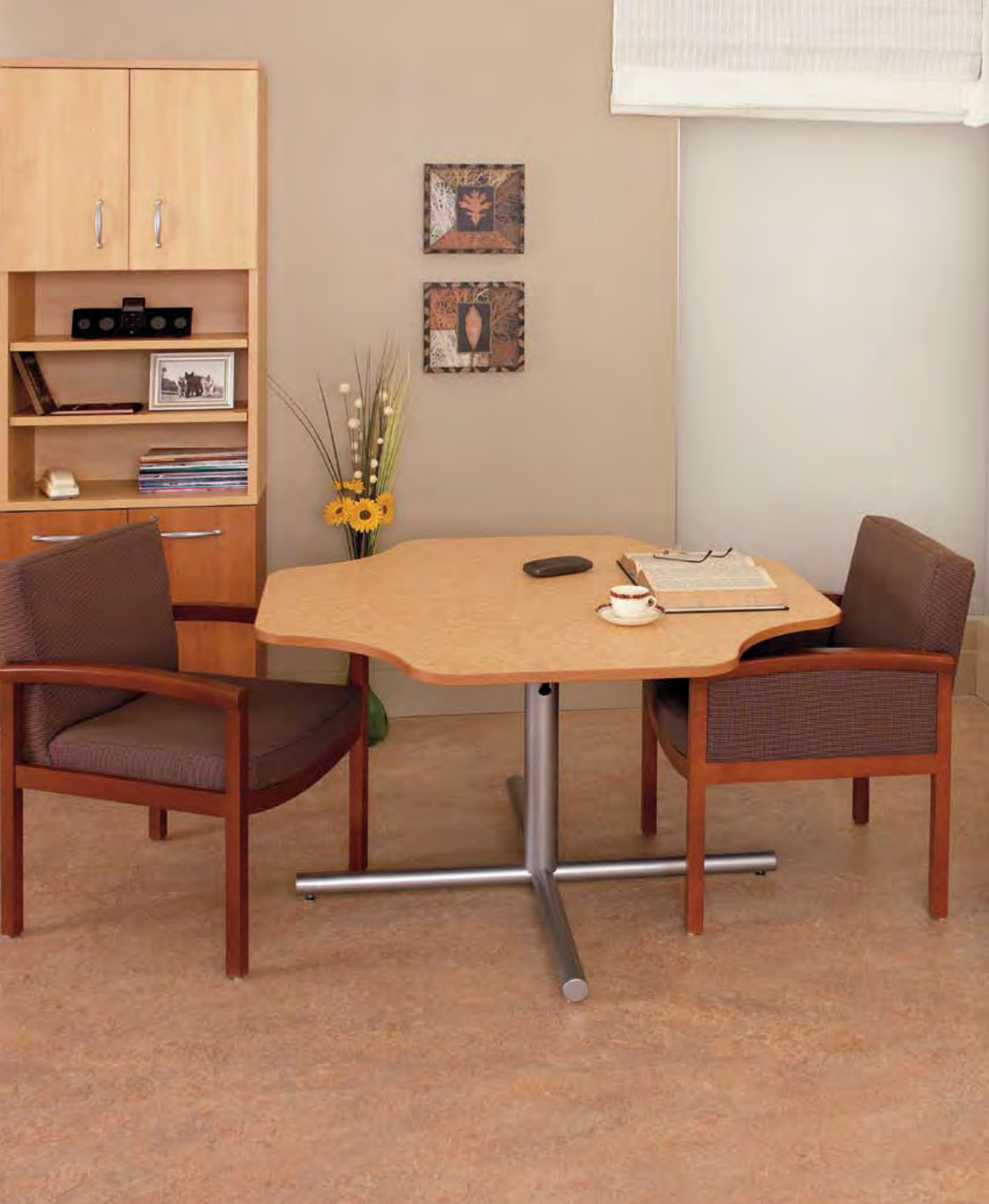
14 Salle d'activités «Sur-mesure» ~ «Custom» Activity Room