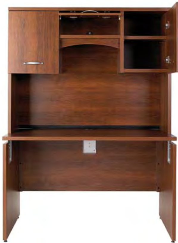
«SUR-MESURE» ~ «Custom»